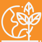
Vinculación con el ecosistema