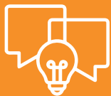
Desarrollo de Ideas e Innovaciones