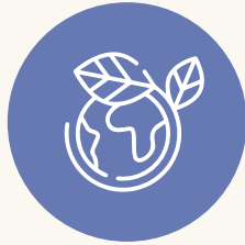
Sostenibilidad y Medio Ambiente